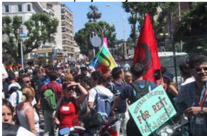
Le 20 mai à Cannes pendant le Festival