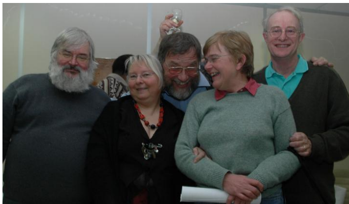
Elle est ici en compagnie de quatre secrétaires généraux avec lesquels elle a travaillé