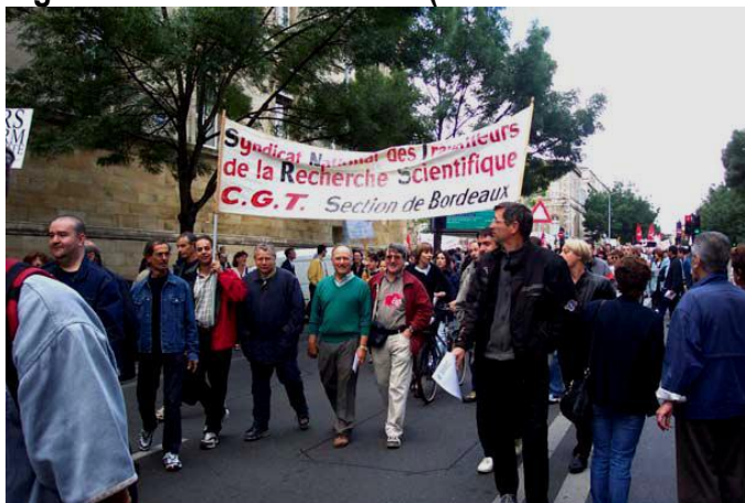
Le 3 juin à Bordeaux

250 000 manifestants à Paris (plus de 2 400 000 sur toute la France). La participation dans notre secteur est très forte. Il y a 1500 personnes derrière la banderole du SNTRS. Plusieurs autres manifestations sont organisées : 19 mai - 25 mai (immense manifestation nationale à Paris) - 3 juin - 10 juin